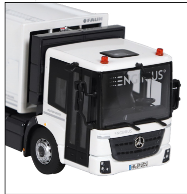
Enginius Windschutzscheibe / Enginius windshield