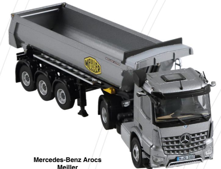
Mercedes-Benz Arocs Meiller Kippsattel / Tipping semi-trailer

Maßstab / Scale : 1:50 Länge / Length : 245 mm