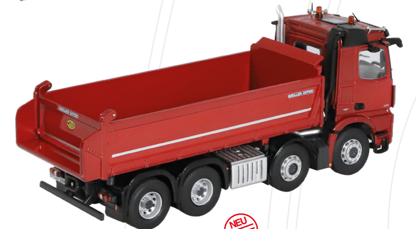
Mercedes-Benz Arocs 8x4 MirrorCam Meiller-Kipper

Maßstab / Scale : 1:50 Länge / Length : 175 mm