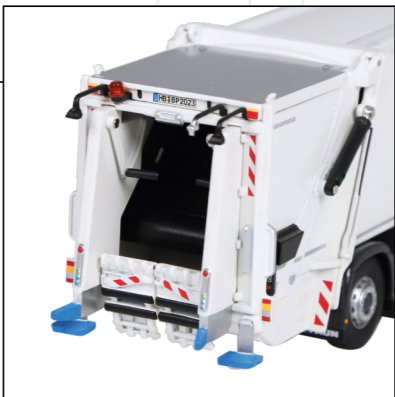
hochdetaillierte Bedieneinheiten / highly detailed control panels