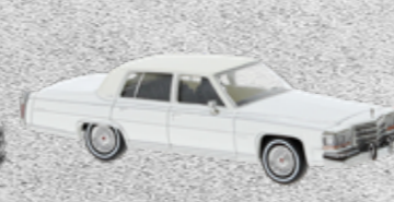
Cadillac Fleetwood Brougham , weiß, 1982 Nr. PCX870449 22.95 € ▲