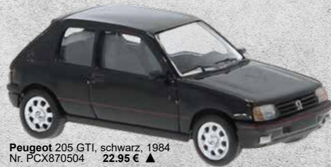
Peugeot 205 GTI , schwarz, 1984 Nr. PCX870504 22.95 € ▲