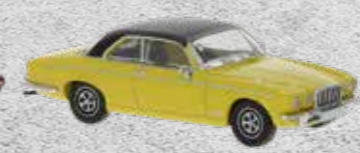
Jaguar XJ-C , 1973 Nr. PCX870167 19.95 € ▲