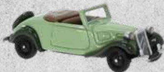
Citroen Traction Avant Cabrio, 1936 Nr. BoS87730 22.95 € ▲