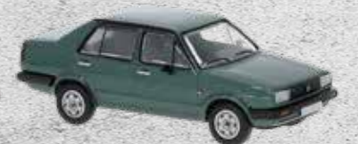
VW Jetta II , grün-met., 1984 Nr. PCX870196 22.95 € ▲