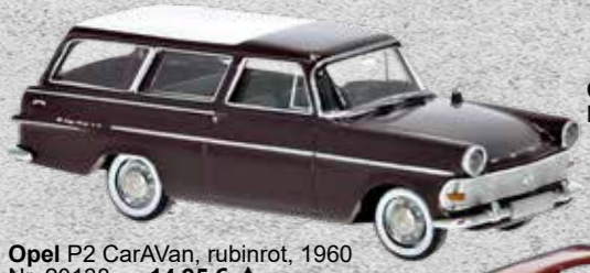
Opel P2 CarAVan, rubinrot, 1960 Nr. 20138 14.95 € ▲