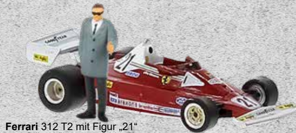
Ferrari 312 T2 mit Figur „21“ von Gilles Villeneuve, 1977 Nr. v 22977 22.95 € ▲