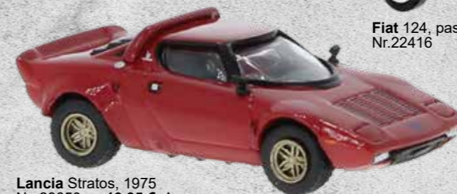
Lancia Stratos, 1975 Nr. 29650 19.95 € ▲