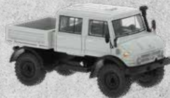
Unimog U416 Doka, 1977 Nr. BoS87318 34.95 € ▲