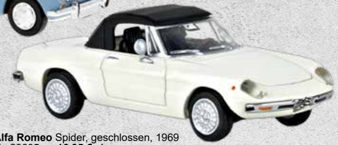
Alfa Romeo Spider, geschlossen, 1969 Nr. 29605 16.95 € ▲