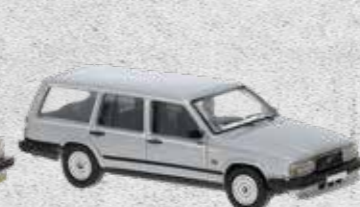
Volvo 740 Kombi , silber, 1985 Nr. PCX870664 22.95 € ▲