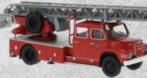
MAN 520H DLK 30 der Feuerwehr Berlin, 1967 Nr. n 45163 39.95 € ▲