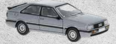
Audi Coupé , grau-met., 1985 Nr. PCX870269 22.95 € ▲