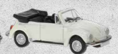
VW Käfer 1303 Cabrio , 1979 Nr. PCX870517 22.95 € ▲