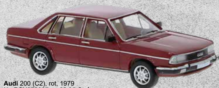
Audi 200 (C2) , rot, 1979 Nr. PCX870067 22.95 € ▲