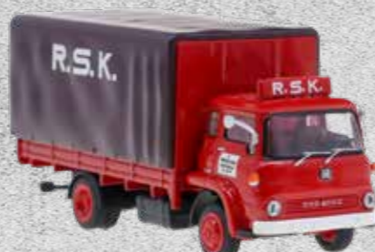
Bedford TK Pritsche/Plane "RSK/Den Haag" (NL), 1971 Nr. v 35930 24.95 € ▲