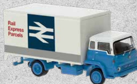
Bedford TK Koffer "British Rail" (GB), 1971 Nr. v 35926 24.95 € ▲