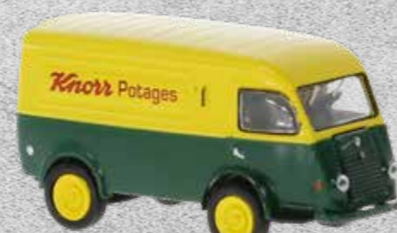
Renault 1000kg "Knorr" (F), 1950 Nr. 14664 16.95 € ▲