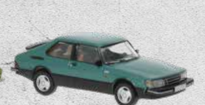
Saab 900 turbo , türkis-met., 1986 Nr. PCX870649 22.95 € ▲