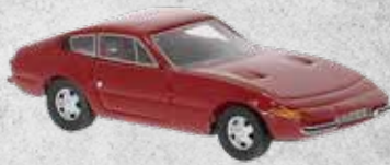
Ferrari 365 GTB/4, 1972 Nr. BoS87631 22.95 € ▲