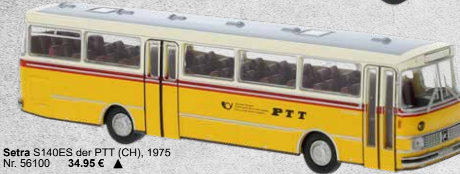
Setra S140ES der PTT (CH), 1975 Nr. 56100 34.95 € ▲