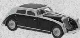
Maybach Zeppelin Spohn-Stromlinie, 1932 Nr. BoS87650 24.95 € ▲