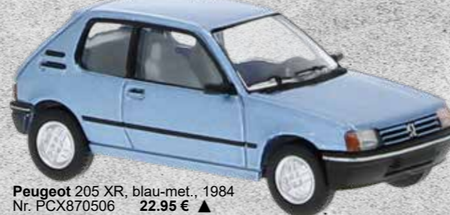
Peugeot 205 XR , blau-met., 1984 Nr. PCX870506 22.95 € ▲