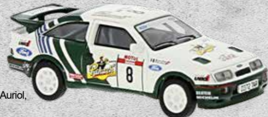
Ford Sierra RS500 von Didier Auriol, Sieger Tour de Corse, 1988 Nr. 19261 19.95 € ▶