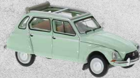
Citroen Dyane mit offenem Dach, pastelgrün, 1976 Nr. n 14253 16.95 € ▲