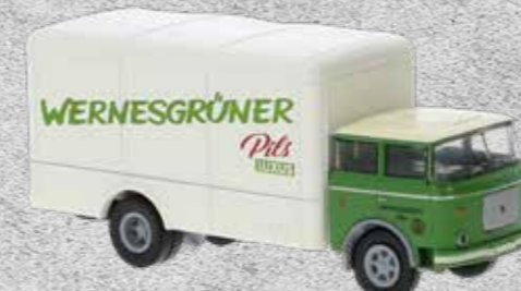
LIAZ 706 "Wernesgrüner", 1970 Nr. 71859 21.95 € ▲