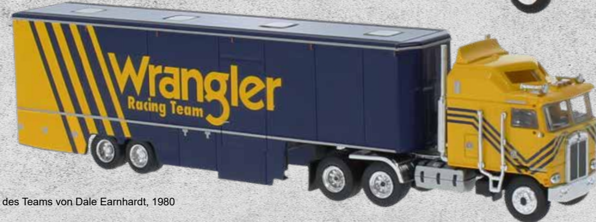
Kenworth K100 racetruck des Teams von Dale Earnhardt, 1980 Nr. 85737 37.95 € ►