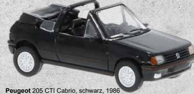
Peugeot 205 CTI Cabrio , schwarz, 1986 Nr. PCX870503 22.95 € ▲