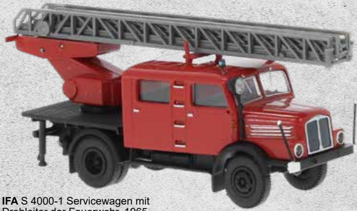
IFA S 4000-1 Servicewagen mit Drehleiter der Feuerwehr, 1965 Nr. n 71765 29.95 € ▲