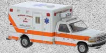
Ford F-350 Horton Ambulance , 1997 Nr. PCX870363 27.95 € ▲