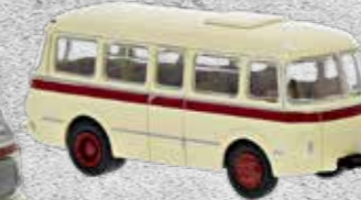
JZS Jelcz 043 mit Anhänger PA 01, 1964 Nr. 58273 42.95 € ▲