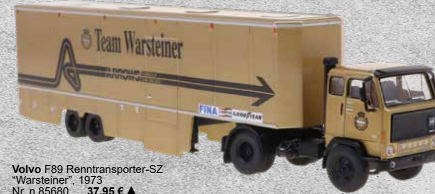
Volvo F89 Renntransporter-SZ "Warsteiner", 1973 Nr. n 85680 37.95 € ▲