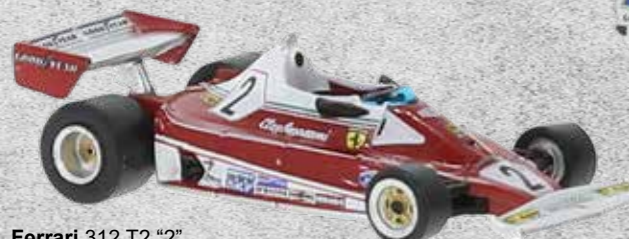
Ferrari 312 T2 "2" von Clay Regazzoni, 1976 Nr. v 22976 19.95 € ▲