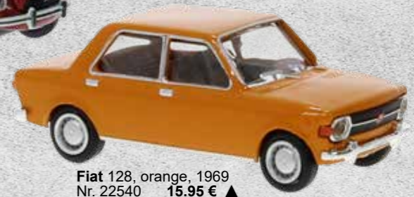
Fiat 128, orange, 1969 Nr. 22540 15.95 € ▲