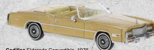
Cadillac Eldorado Convertible, 1976 Nr. 19752 19.95 € ▲