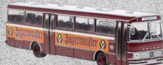
Setra S140ES "Jägermeister" der DB, 1975 Nr. 56104 34.95 € ▲