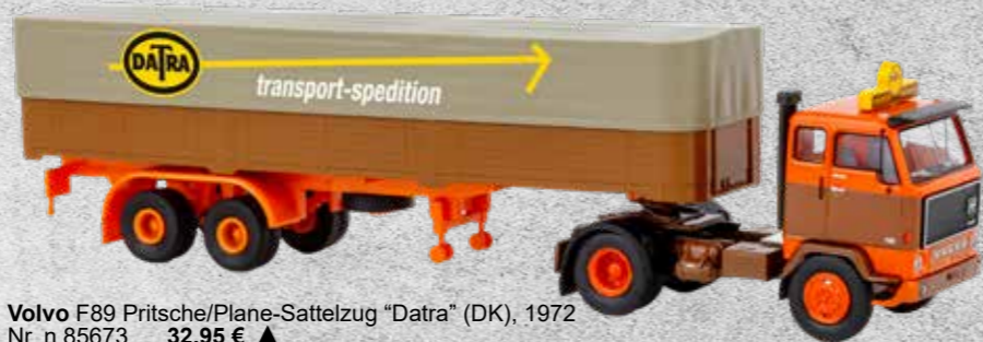
Volvo F89 Pritsche/Plane-Sattelzug "Datra" (DK), 1972 Nr. n 85673 32.95 € ▲