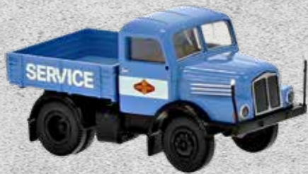
IFA S 4000-1 Zugmaschine "Fortschritt", 1960 Nr. 71455 19.95 € ▲