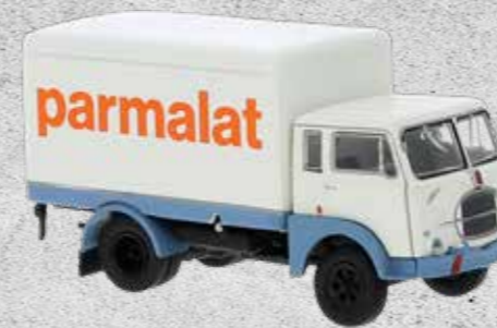
Fiat 642 Koffer "Parmalat" (I), 1962 Nr. v 58610 25.95 € ▲