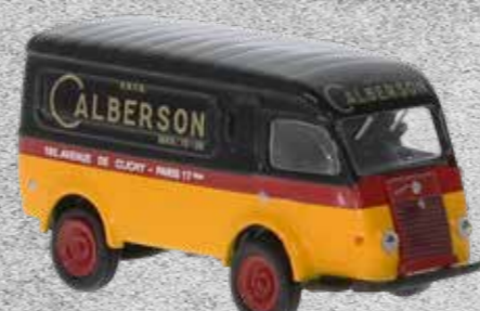
Renault 1000kg "Calberson" (F), 1950 Nr. 14667 16.95 € ▲