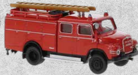
MAN 450 HA TLF 16, schwarze Kotflügel, 1960 Nr. 45130 31.95 € ▲