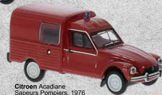
Citroen Acadiane Sapeurs Pompiers, 1976 Nr. v 14280 16.95 € ▲