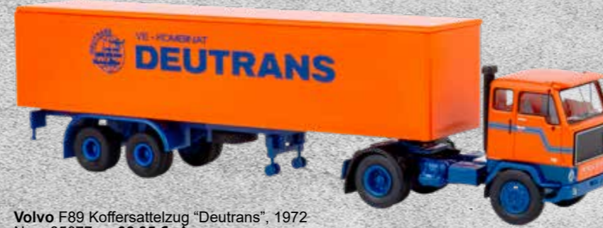
Volvo F89 Koffersattelzug "Deutrans", 1972 Nr. n 85677 32.95 € ▲