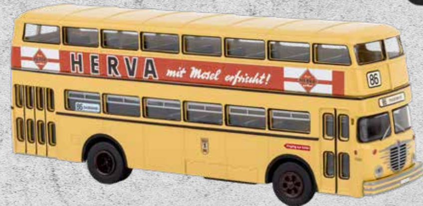
◀ Büssing D2U "Herva" der BVG, 1960 Nr. v 61265 34.95 €