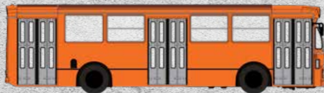
Fiat Bus 418, zweifarbig (I), 1972 Nr. n 59951 34.95 € ▶