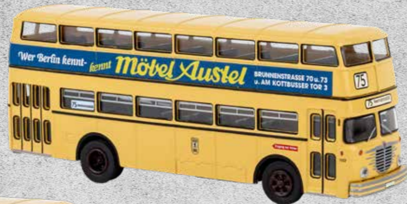
Büssing D2U "Möbel Ausstel" der BVG, 1960 Nr. v 61263 34.95 € ▶