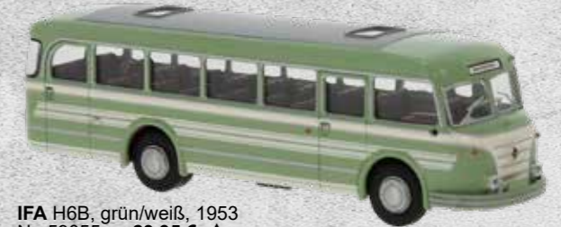
IFA H6B, grün/weiß, 1953 Nr. 59855 29.95 € ▲