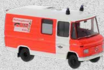
Mercedes-Benz L 508 RTW Rettungsdienst Köln, 1978 Nr. v 36939 21.95 € ▲