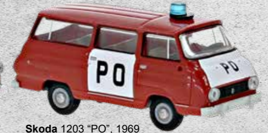
Skoda 1203 "PO", 1969 Nr. 30817 17.95 € ▲