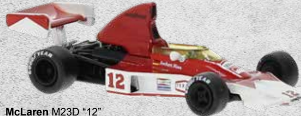
McLaren M23D "12" von Jochen Mass, 1976 Nr. n 22951 19.95 € ▲