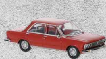
Fiat 130 , rot, 1969 Nr. PCX870636 22.95 € ▲