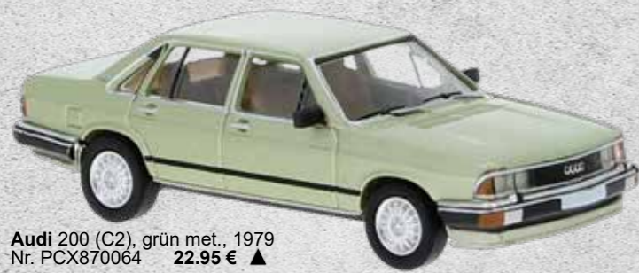
Audi 200 (C2) , grün met., 1979 Nr. PCX870064 22.95 € ▲