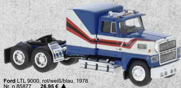
Ford LTL 9000, rot/weiß/blau, 1978 Nr. n 85877 26.95 € ▲