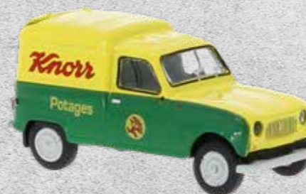
Renault R4 Fourgonnette "Knorr" (F), 1961 Nr. 14752 14.95 € ▲