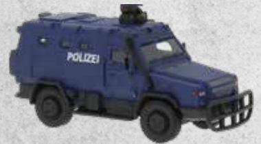
Rheinmetall Defence, 2018 Nr. BoS87801 34.95 € ▲