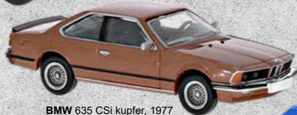
BMW 635 CSi kupfer, 1977 Nr. 24359 17.95 € ▲