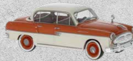
Sachsenring P 240, orange/weiß, 1956 Nr. 27479 12.00 € ▲