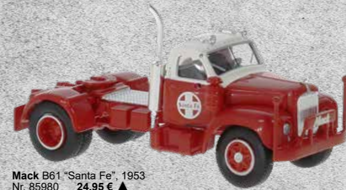
Mack B61 "Santa Fe", 1953 Nr. 85980 24.95 € ▲