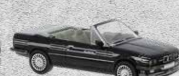
BMW Alpina C2 Cabriolet , schwarz, 1986 Nr. PCX870446 22.95 € ▲