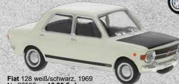
Fiat 128 weiß/schwarz, 1969 Nr. 22536 16.95 € ▲