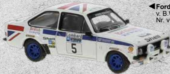
◀ Ford Escort RS1800 "Br-Airways" v. B. Waldegard, RAC-Sieger, 1977 Nr. v 19584 21.95 €