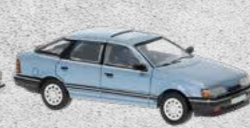
Ford Scorpio GL , blau-met., 1985 Nr. PCX870459 22.95 € ▲