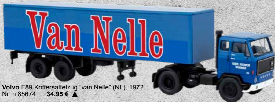
Volvo F89 Koffersattelzug "van Nelle" (NL), 1972 Nr. n 85674 34.95 € ▲