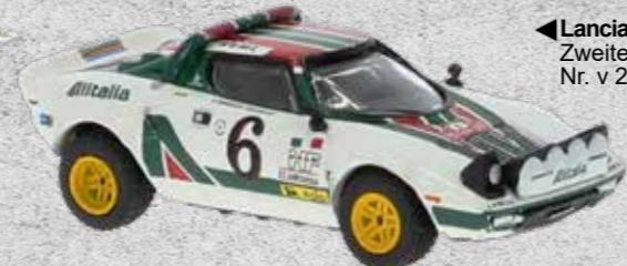
◀ Lancia Stratos HF von Björn Waldegard, Zweiter Monte Carlo, 1976 Nr. v 29656 21.95 €