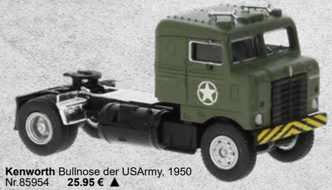
Kenworth Bullnose der USArmy, 1950 Nr. 85954 25.95 € ▲