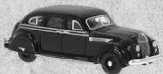
Chrysler Airflow, 1936 Nr. BoS87130 19.95 € ▲