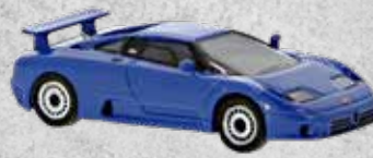
Bugatti EB 110, 1991 Nr. BoS87555 22.95 € ▲