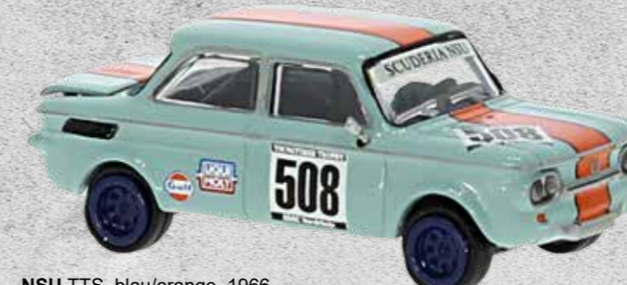
NSU TTS, blau/orange, 1966 Nr. 28259 17.95 € ▲