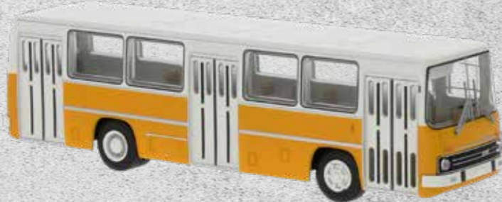
Ikarus 260, weiß/gelb, 1972 Nr. 59806 29.95 € ▲