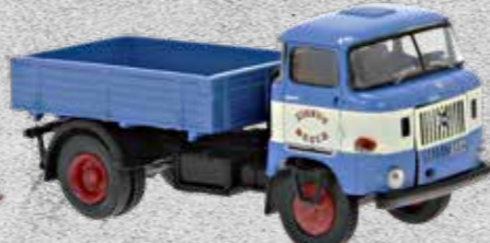
IFA W50 Zugmaschine des Circus Busch, 1965 Nr. 71254 22.95 € ▲