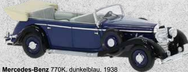
Mercedes-Benz 770K, dunkelblau, 1938 Nr. v 21053 19.95 € ▲