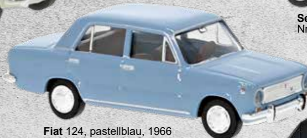
Fiat 124, pastellblau, 1966 Nr. 22416 15.95 € ▲