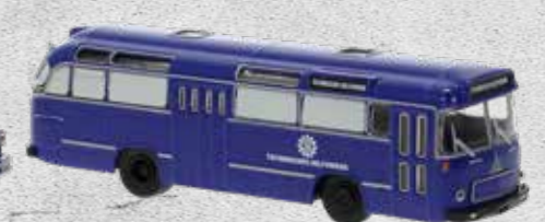
Magirus Saturn II des THW, 1960 Nr. 59530 34.95 € ▲