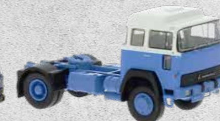
Magirus 310 D16 SZM, weiß/blau, 1974 Nr. 83283 19.95 € ▲