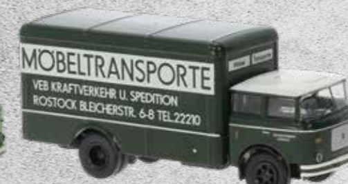
LIAZ 706 "Möbeltransporte", 1970 Nr. 71856 21.95 € ▲