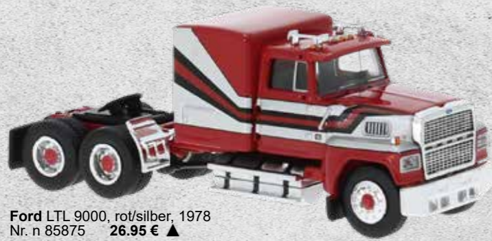
Ford LTL 9000, rot/silber, 1978 Nr. n 85875 26.95 € ▲