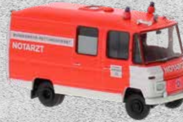
Mercedes-Benz L 508 RTW Bundeswehr Notarzt, 1978 Nr. v 36943 21.95 € ▲