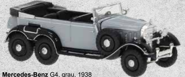
Mercedes-Benz G4, grau, 1938 Nr. n 21076 19.95 € ▲