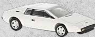
Lotus Esprit S1, 1977 Nr. BoS87500 22.95 € ▲