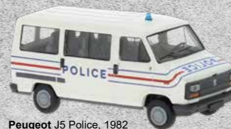
Peugeot J5 Police, 1982 Nr. 34914 18.95 € ▲