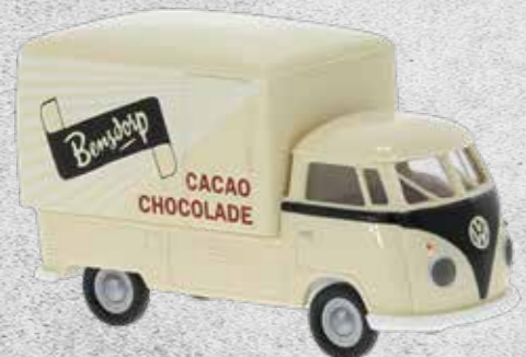
VW T1b Großraumkoffer "Bensdorp" (NL), 1960 Nr. v 32853 21.95 € ▲