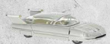
Borgward Traumwagen, 1955 Nr. BoS87230 19.95 € ▲