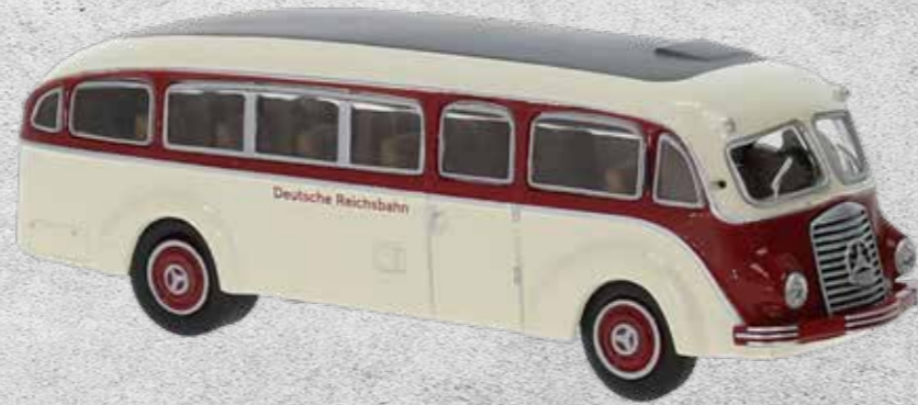
Mercedes-Benz LO3500 der Deutschen Reichsbahn, 1936 Nr. v 52433 29.95 € ▲