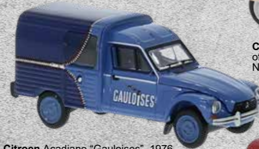
Citroen Acadiane "Gauloises", 1976 Nr. v 14282 18.95 € ▲