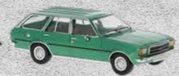
Opel Rekord D CarAVan , grün-met., 1972 Nr. PCX870401 19.95 € ▲