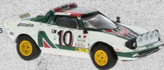
Lancia Stratos HF von Sandro Munari, Sieger Monte Carlo, 1976 Nr. v 29655 21.95 € ▶