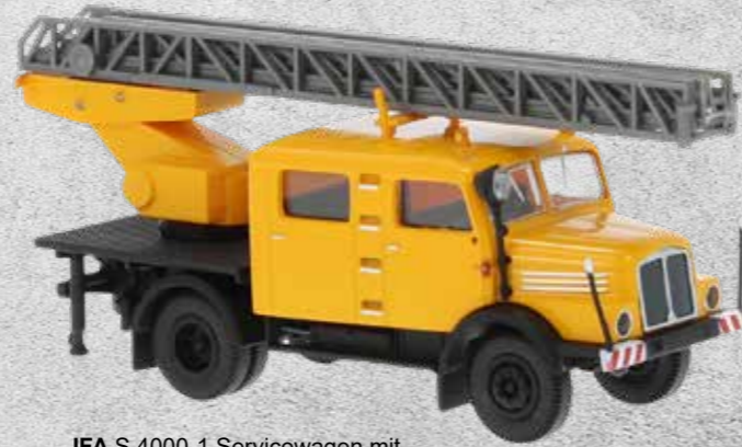
IFA S 4000-1 Servicewagen mit Drehleiter, kommunal, 1965 Nr. n 71766 29.95 € ▲