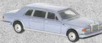
Rolls-Royce Silver Spur, 1935 Nr. BoS87360 32.95 € ▲