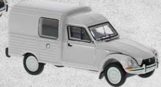
Citroen Acadiane, grau, 1976 Nr. v 14279 16.95 € ▲