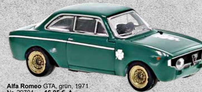
Alfa Romeo GTA, grün, 1971 Nr. 29704 16.95 € ▲