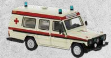
Mercedes-Benz G-Klasse Binz-Krankenwagen, 1985 Nr. BoS87825 29.95 € ▲