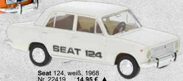
Seat 124, weiß, 1968 Nr. 22419 14.95 € ▲