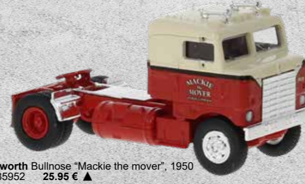
Kenworth Bullnose "Mackie the mover", 1950 Nr. 85952 25.95 € ▲