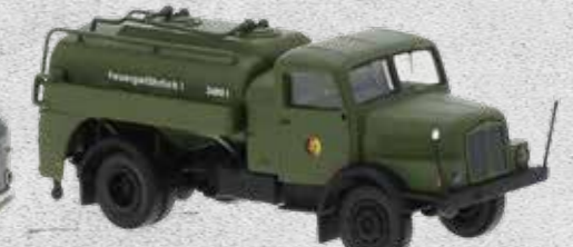
IFA S 4000-1 Tankwagen der NVA, 1960 Nr. 71477 29.95 € ▲