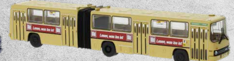
Ikarus 280.02 "Bild" der BVG, 1991 Nr. 59735 39.95 € ▲