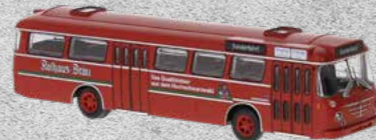
Büssing Senator 12D "Rothaus" aus Konstanz, 1962 Nr. 59376 34.95 € ▲