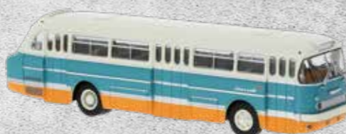
Ikarus 66 3-türige Stadtversion, weiß/türkis, 1965 Nr. n 59576 29.95 € ▲