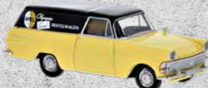
Opel P2 "Snel bestelwagen" (NL), 1960 Nr. 20072 15.95 € ▲