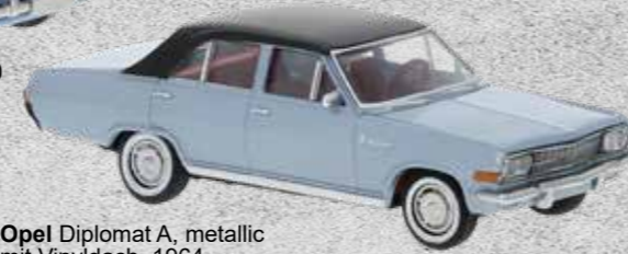
Opel Diplomat A, metallic mit Vinyl Dach, 1964 Nr. 20761 14.95 € ▲