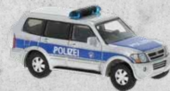
Mitsubishi Pajero der Polizei, 2003 Nr. BoS87496 22.95 € ▲