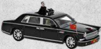
Hongqi L9, 2017 Nr. BoS87796 34.95 € ▲