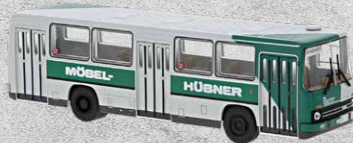
Ikarus 260 "Möbel-Hübner" aus Potsdam, 1972 Nr. 59810 31.95 € ▲