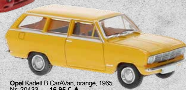
Opel Kadett B CarAVan, orange, 1965 Nr. 20433 16.95 € ▲