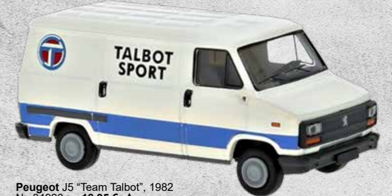
Peugeot J5 "Team Talbot", 1982 Nr. 34920 18.95 € ▲