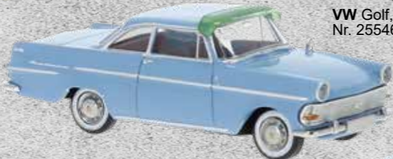
Opel P2 Coupé mit Sonnenblende, 1960 Nr. 20134 14.95 € ▲