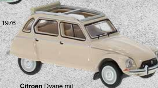
Citroen Dyane mit offenem Dach, beige, 1976 Nr. n 14254 16.95 € ▲