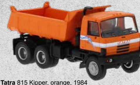
Tatra 815 Kipper, orange, 1984 Nr. 71905 26.95 € ▲