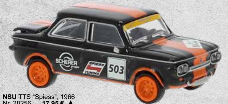
NSU TTS "Spieß", 1966 Nr. 28256 17.95 € ▲