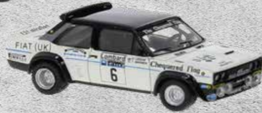
Fiat 131 Abarth "Fiat UK" von Timo Makinen, RAC, 1977 Nr. v 22660 21.95 €