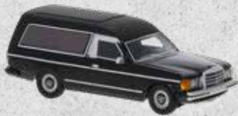
Mercedes-Benz W123 Bestatter Nr. BoS87655 24.95 € ▲