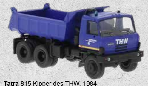
Tatra 815 Kipper des THW, 1984 Nr. 71906 27.95 € ▲