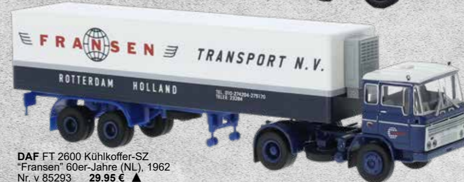
DAF FT 2600 Kühlkoffer-SZ "Fransen" 60er-Jahre (NL), 1962 Nr. v 85293 29.95 € ▲