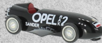
Opel RAK 2, 1928 Nr. BoS87380 29.95 € ▲