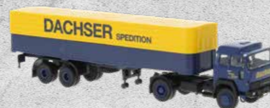
Magirus 310 D16 Sattelzug "Dachser", 1974 Nr. 83254 32.95 € ▲