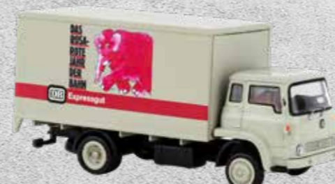
Bedford TK Koffer der DB "rosarote Wochen", 1971 Nr. v 35931 24.95 € ▲