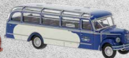
Borgward BO4000 "Borgward-Werkverkehr", 1951 Nr. 52405 32.95 € ▲