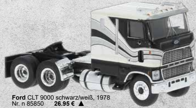
Ford CLT 9000 schwarz/weiß, 1978 Nr. n 85850 26.95 € ▲