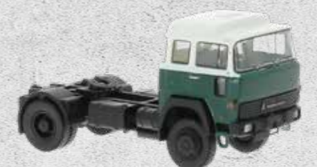
Magirus 310 D16 SZM, weiß/grün, 1974 Nr. 83282 19.95 € ▲