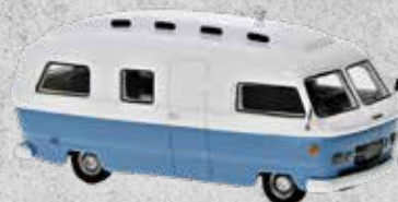
Mercedes-Benz L206 'Orion', 1975 Nr. BoS87780 34.95 € ▲