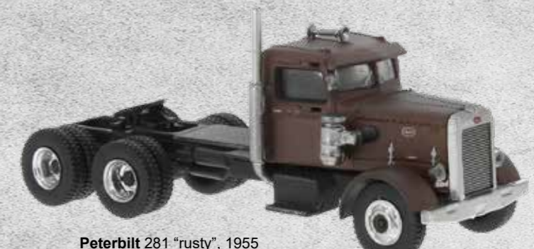
Peterbilt 281 "rusty", 1955 Nr. 85752 24.95 € ▲