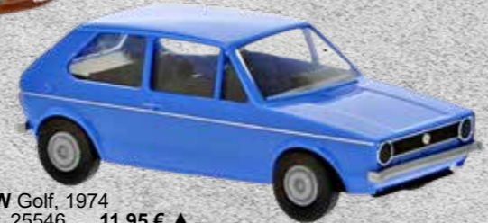
VW Golf, 1974 Nr. 25546 11.95 € ▲