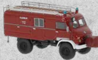
Unimog 404S LF8, 1962 Nr. BoS87787 34.95 € ▲