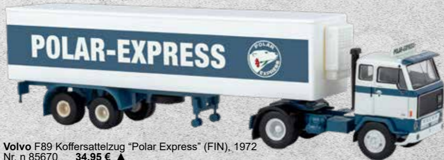
Volvo F89 Koffersattelzug "Polar Express" (FIN), 1972 Nr. n 85670 34.95 € ▲