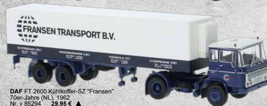
DAF FT 2600 Kühlkoffer-SZ "Fransen" 70er-Jahre (NL), 1962 Nr. v 85294 29.95 € ▲