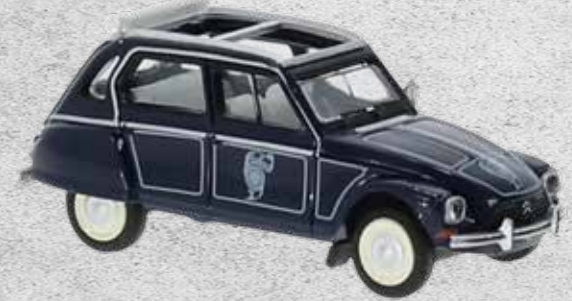
Citroen Dyane mit offenem Dach, Sondermodell "Caban", 1976 Nr. n 14256 16.95 € ▲