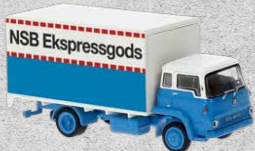
Bedford TK Koffer "NSB" (N), 1971 Nr. v 35925 24.95 € ▲