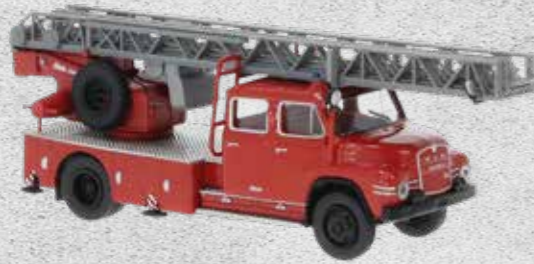
MAN 520H DLK 30 schwarze Kotflügel, 1967 Nr. n 45160 39.95 € ▲