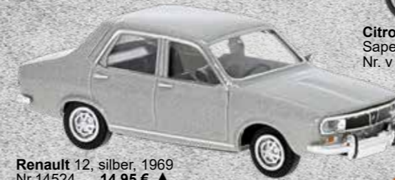
Renault 12, silber, 1969 Nr. 14524 14.95 € ▲