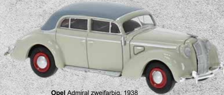
Opel Admiral zweifarbig, 1938 Nr. v 20454 19.95 € ▲