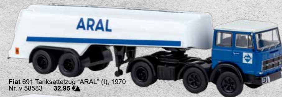
Fiat 691 Tanksattelzug "ARAL" (I), 1970 Nr. v 58583 32.95 € ▲