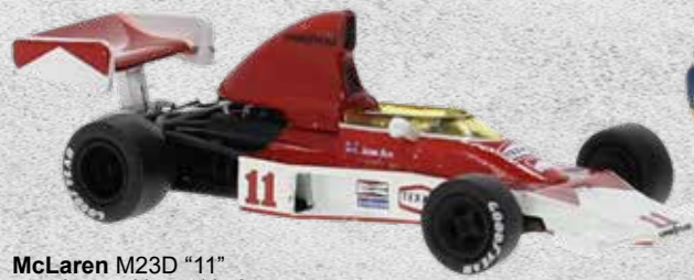
McLaren M23D "11" von James Hunt, 1976 Nr. n 22950 19.95 € ▲