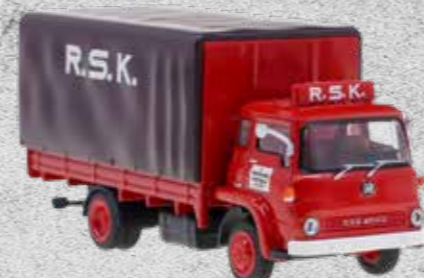
Bedford TK Pritsche/Plane "RSK/Amsterdam" (NL), 1971 Nr. v 35929 24.95 € ▲