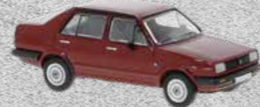
VW Jetta II , rot, 1984 Nr. PCX870197 22.95 € ▲