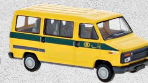
Citroen C25 der belg. Bahn (B), 1982 Nr. 34923 18.95 € ▲