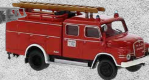
MAN 450 HA TLF 16, weiße Kotflügel, 1960 Nr. 45131 31.95 € ▲