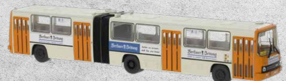
Ikarus 280.02 BVB - Berliner Zeitung, 1990 Nr. 59729 39.95 € ▲