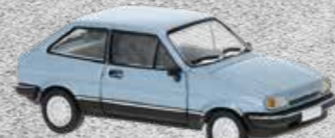
Ford Fiesta Ghia Mk.II , blau-met., 1985 Nr. PCX870279 22.95 € ▲