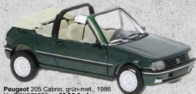
Peugeot 205 Cabrio , grün-met., 1986 Nr. PCX870500 22.95 € ▲