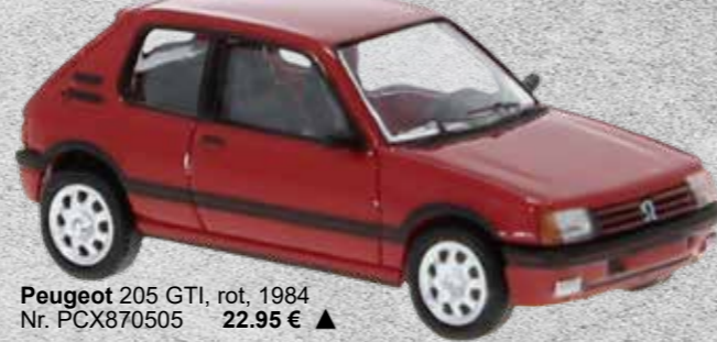
Peugeot 205 GTI , rot, 1984 Nr. PCX870505 22.95 € ▲