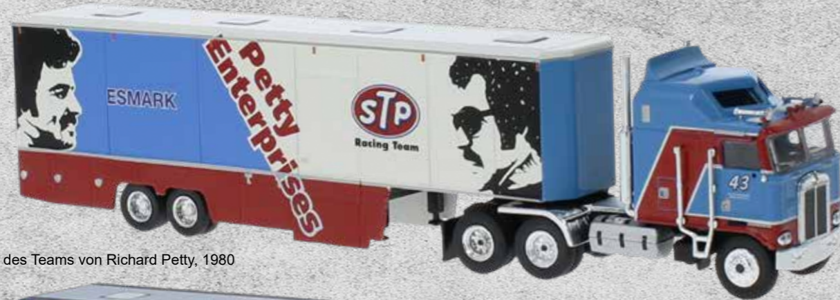
Kenworth K100 racetruck des Teams von Richard Petty, 1980 Nr. 85736 37.95 € ►