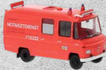
Mercedes-Benz L 508 RTW BFW München, 1978 Nr. v 36942 21.95 € ▲