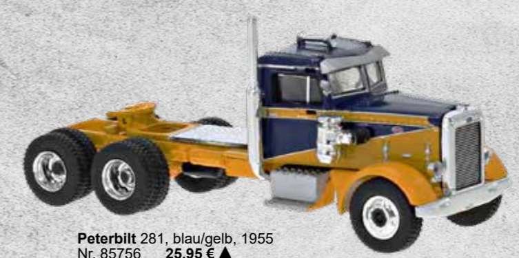
Peterbilt 281, blau/gelb, 1955 Nr. 85756 25.95 € ▲