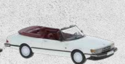
Saab 900 Cabrio , weiß, 1986 Nr. PCX870668 22.95 € ▲