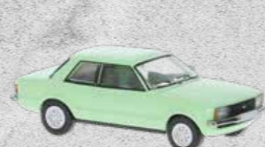
Ford Taunus TC2 , grün, 1976 Nr. PCX870656 22.95 € ▲