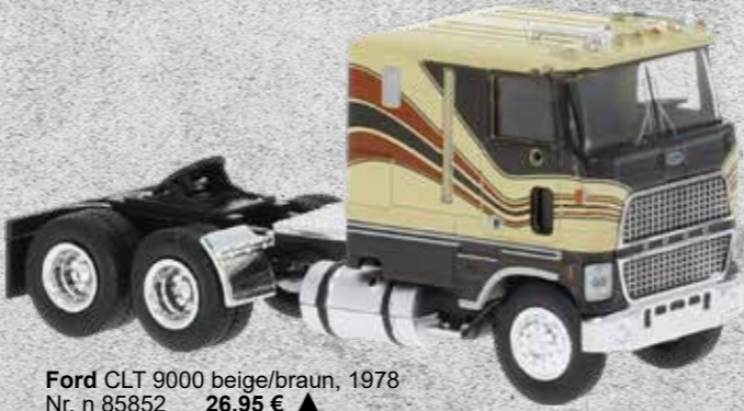
Ford CLT 9000 beige/braun, 1978 Nr. n 85852 26.95 € ▲