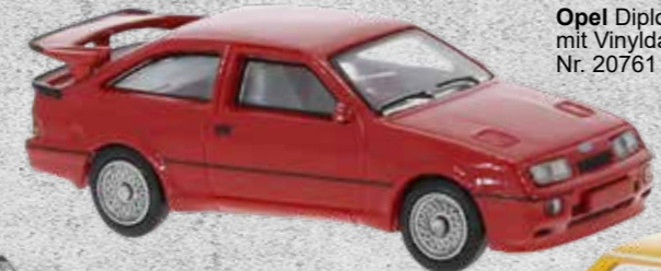
Ford Sierra Cosworth, 1988 Nr. 19258 17.95 € ▲