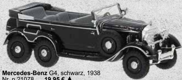
Mercedes-Benz G4, schwarz, 1938 Nr. n 21078 19.95 € ▲