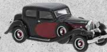
Bugatti Typ 57 Galibier, 1934 Nr. BoS87836 24.95 € ▲