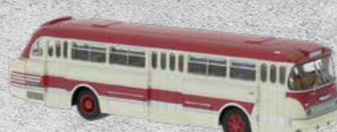
Ikarus 66 3-türige Stadtversion, weiß/rot, 1965 Nr. n 59577 29.95 € ▲