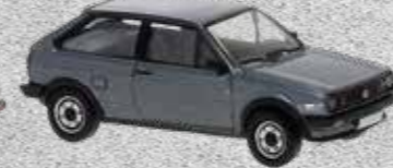
VW Polo II Coupé , grau-met., 1985 Nr. PCX870201 19.95 € ▲