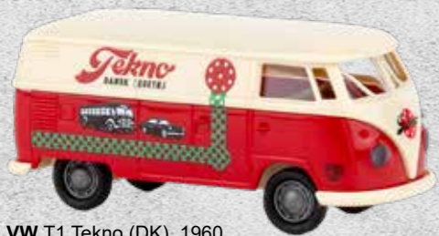
VW T1 Tekno (DK), 1960 Nr. v 32780 14.95 € ▲