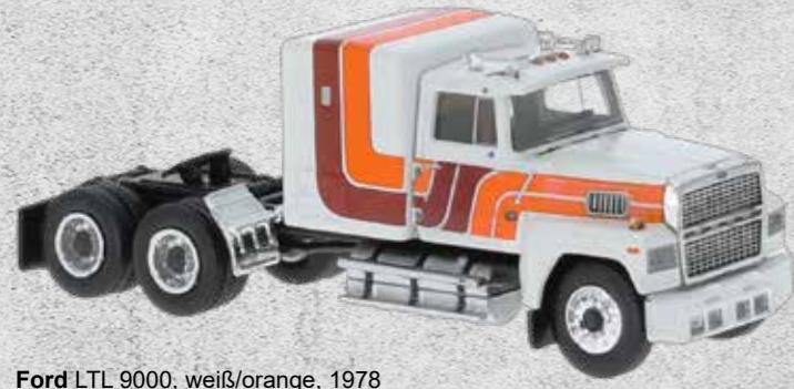
Ford LTL 9000, weiß/orange, 1978 Nr. n 85876 26.95 € ▲