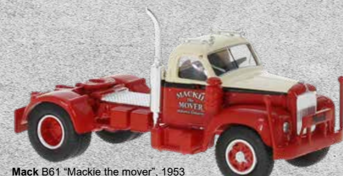
Mack B61 "Mackie the mover", 1953 Nr. 85977 24.95 € ▲