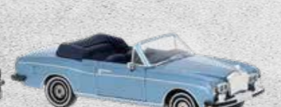
Rolls Royce Corniche , blau-met., 1971 Nr. PCX870513 22.95 € ▲