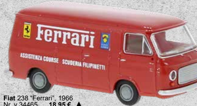
Fiat 238 "Ferrari", 1966 Nr. v 34465 18.95 € ▲