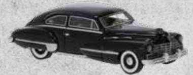
Cadillac '62 Club Coupé Nr. BoS87700 22.95 € ▲