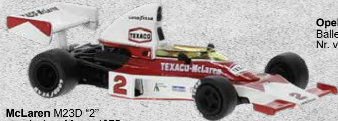
McLaren M23D "2" von Jochen Mass, 1975 Nr. n 22953 19.95 € ▲