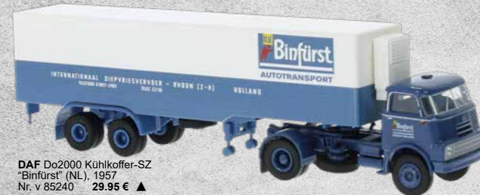
DAF Do2000 Kühlkoffer-SZ "Binfurst" (NL), 1957 Nr. v 85240 29.95 € ▲