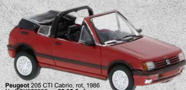
Peugeot 205 CTI Cabrio , rot, 1986 Nr. PCX870502 22.95 € ▲