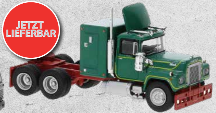
Mack RS 700, grün, 1966 Nr. 85803 24.95 € ▲