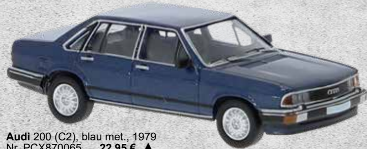
Audi 200 (C2) , blau met., 1979 Nr. PCX870065 22.95 € ▲