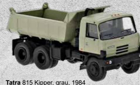
Tatra 815 Kipper, grau, 1984 Nr. 71902 26.95 € ▲