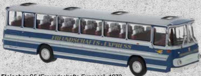
Fleischer S5 "Freundschafts-Express", 1973 Nr. 59932 32.95 € ▲