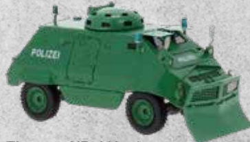
Thyssen UR-416 mit Räumschaukel, minzgrün, 1975 Nr. BoS87832 34.95 € ▲