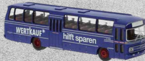
Mercedes-Benz O302 "Wertkauf", 1970 Nr. 52103 34.95 € ▲