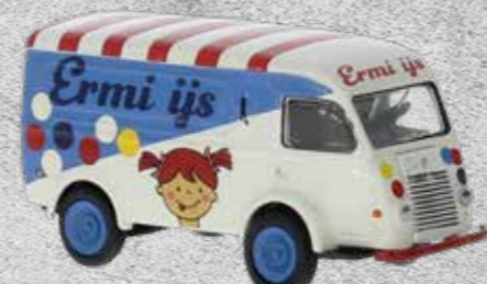
Renault 1000kg "Ermi ijs" (NL), 1950 Nr. 14662 17.95 € ▲