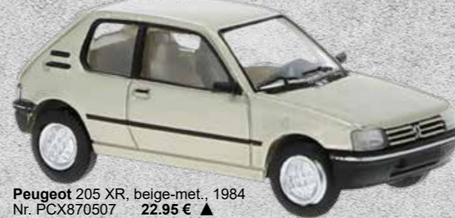
Peugeot 205 XR , beige-met., 1984 Nr. PCX870507 22.95 € ▲