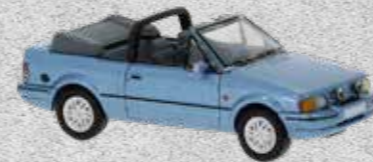
Ford Escort XR3i Cabriolet , 1986 Nr. PCX870158 19.95 € ▲