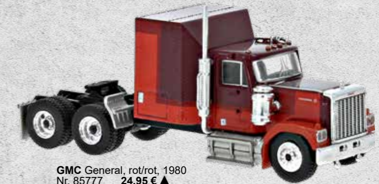
GMC General, rot/rot, 1980 Nr. 85777 24.95 € ▲