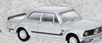
BMW 2002 turbo , silber, 1973 Nr. PCX870441 22.95 € ▲