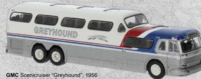
GMC Scenicruiser "Greyhound", 1956 Nr. 61303 32.95 € ▲