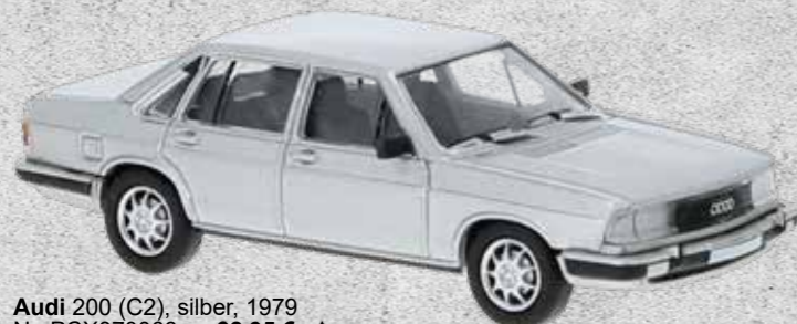
Audi 200 (C2) , silber, 1979 Nr. PCX870066 22.95 € ▲