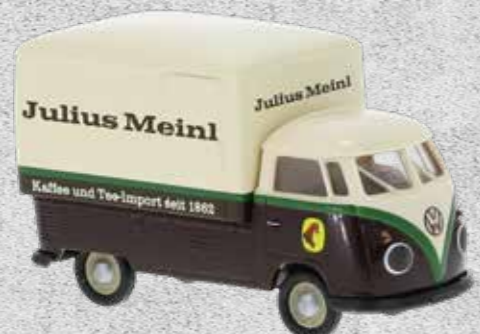
VW T1b Großraumkoffer "Meinl" (A), 1960 Nr. v 32854 21.95 € ▲