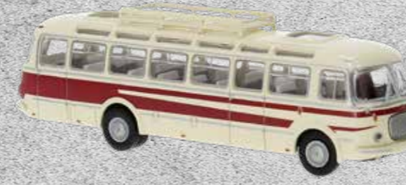
Skoda 706RTO Lux mit Dachrandverglasung Nr. 58235 29.95 € ▲