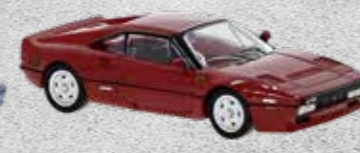
Ferrari GTO , rot, 1984 Nr. PCX870040 19.95 € ▲