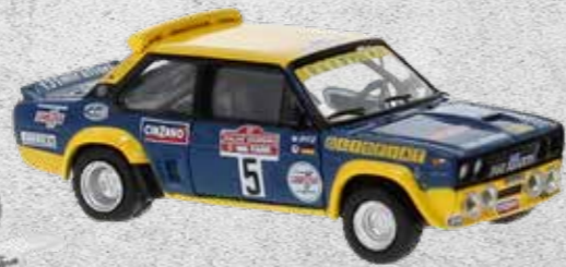
◀ Fiat 131 Abarth "Olio Fiat" von Walter Röhrl, San Remo, 1977 Nr. v 22658 21.95 €