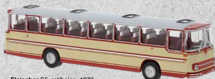
Fleischer S5, rot/beige, 1973 Nr. 59938 32.95 € ▲