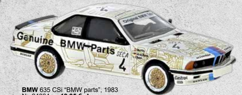
BMW 635 CSI "BMW parts", 1983 Nr. 24364 19.95 € ▲