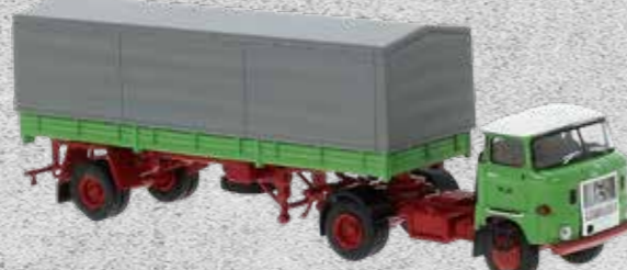
IFA W50 Sattelzug der Deutschen Reichsbahn, 1965 Nr. 71203 29.95 € ▲