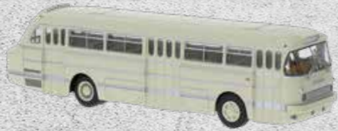
Ikarus 66 3-türige Stadtversion, weiß, 1965 Nr. n 59575 29.95 € ▲