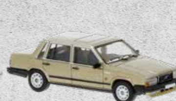
Volvo 740 , gold, 1984 Nr. PCX870660 22.95 € ▲