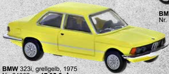
BMW 323i, grellgelb, 1975 Nr. 24302 17.95 € ▲