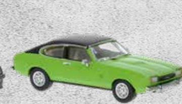
Ford Capri Mk.II , grün, 1974 Nr. PCX870645 22.95 € ▲