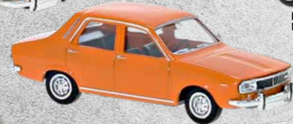
Renault 12, orange, 1969 Nr. 14526 14.95 € ▲