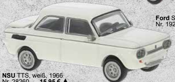
NSU TTS, weiß, 1966 Nr. 28260 15.95 € ▲