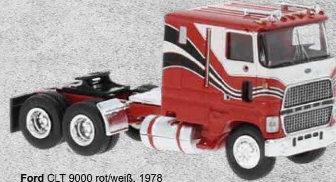
Ford CLT 9000 rot/weiß, 1978 Nr. n 85851 26.95 € ▲