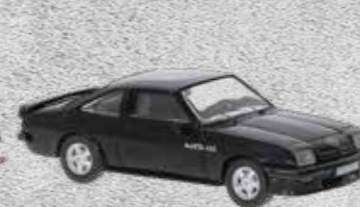
Opel Manta B GSI , schwarz, 1984 Nr. PCX870642 22.95 € ▲