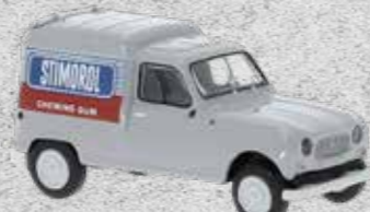
Renault R4 Fourgonnette "Stimorol" (F), 1961 Nr. v 14764 14.95 € ▲