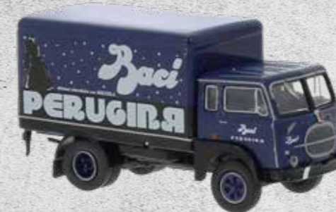
Fiat 642 Koffer "Perugina" (I), 1962 Nr. v 58608 26.95 € ▲