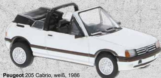
Peugeot 205 Cabrio , weiß, 1986 Nr. PCX870501 22.95 € ▲