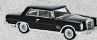
Mercedes-Benz 600 Nallinger-Coupé, 1963 Nr. BoS87695 22.95 € ▲