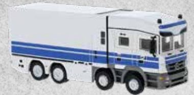
Mercedes-Benz Actros Werttransporter, 2010 Nr. BoS87635 44.95 € ▲