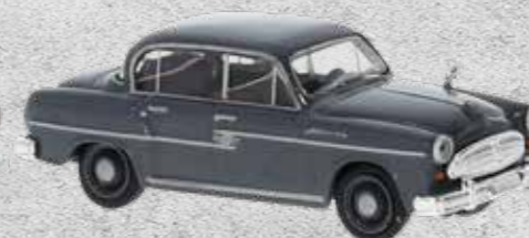
Sachsenring P 240, grau, 1956 Nr. 27478 12.00 € ▲