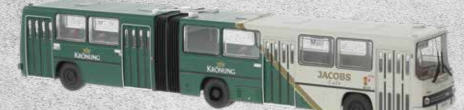
Ikarus 280.02 "Jacobs Krönung" der BVB, 1990 Nr. 59724 41.95 € ▲